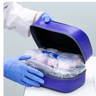
Figur 2. IniCase packad med provrör och förslutningsbar engångspåse